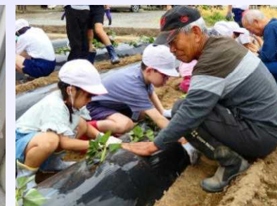
児童に植え方を伝授