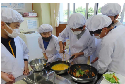
6年生 家庭 調理実習