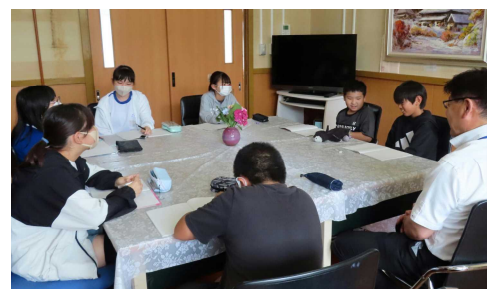
6年生 国語 構成を考えて、提案する文章を書こう (校長先生にインタビューしている様子)