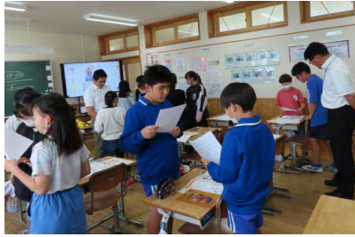
外国語の授業の様子