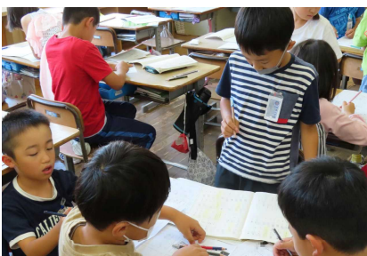
2年生 国語 同じ部分をもつかん字