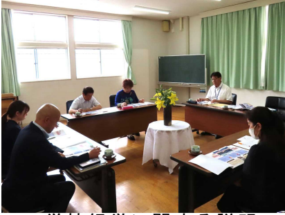
学校経営に関する説明

学校が、保護者や地域住民等の信頼に応え、家庭や地域と連携協力して一体となって子どもたちの健やかな成長を図ることをねらいとして実施しました。学校の様子の説明、授業参観などを通し、学校評議員の方から学校経営に対する貴重な意見をいただきました。