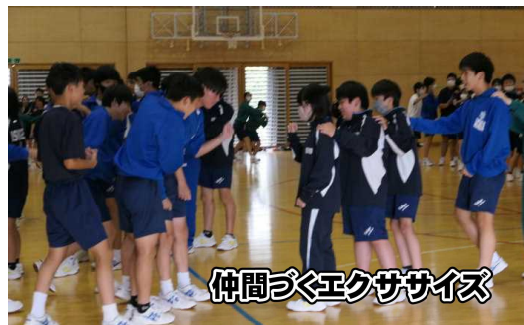
仲間づくりエクササイズ